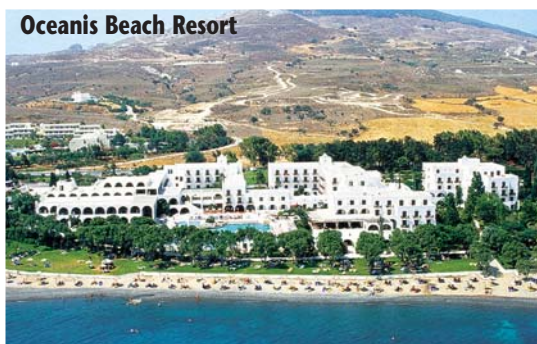
Oceanis Beach Resort