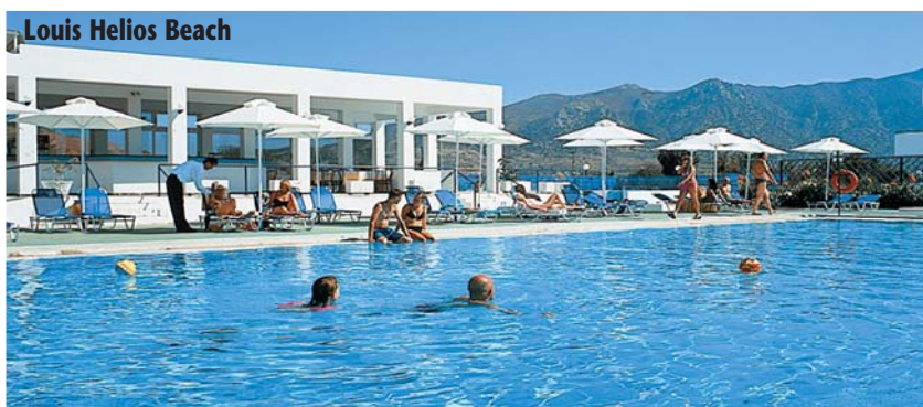
Louis Helios Beach