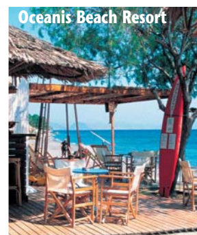
Oceanis Beach Resort